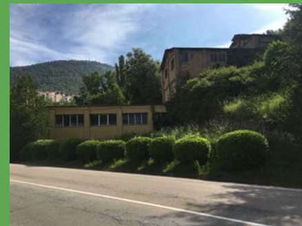
FABRICA LA GUIXERA