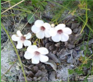
Linum suffruticosum L.