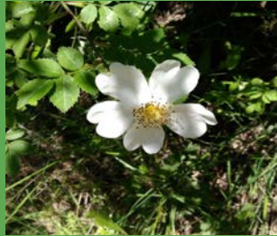
Rosa canina L.