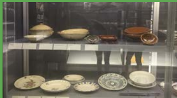
ESTRIS DE CUINA