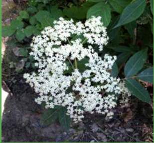
Sambucus nigra L.