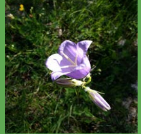
Campanula rotundifolia L.

si ahir era poncella ara és mon tresor -com la satalia cada pit rodó.