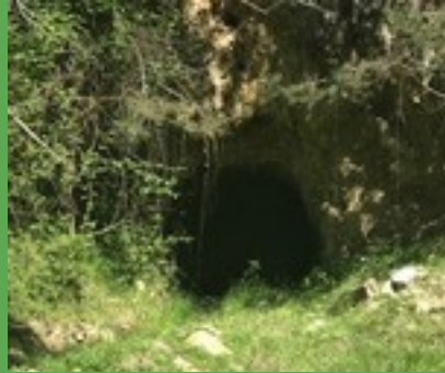
Cova de guix