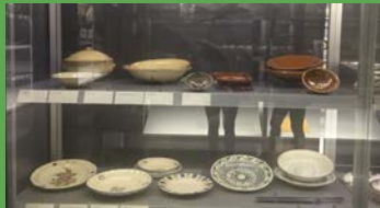
UTENSILIOS DE COCINA