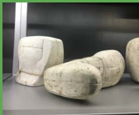
MOLDE DE YESO