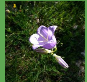
Campanula rotundifolia L.

si ayer era doncella ahora es mi tesoro -como la rosa cada seno redondo