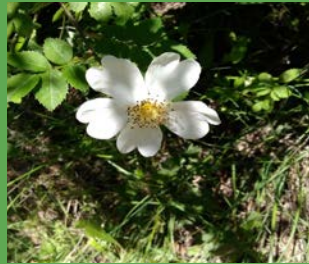
Rosa canina L.