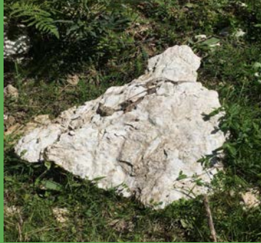
Pedra de guix