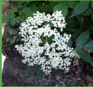
Sambucus nigra L.