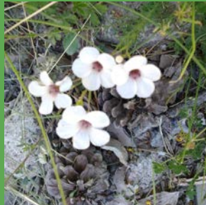
Linum suffruticosum L.