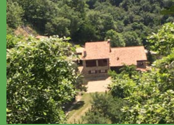
CASA DE ISOLES